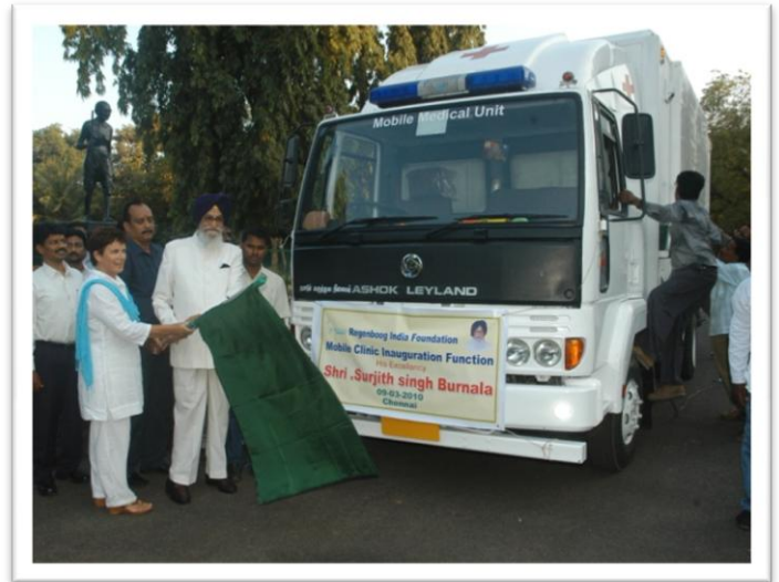
Opening door de gouverneur

De gloednieuwe en goed uitgeruste kliniek op wielen rijdt nu op maandagmorgen de Jawahu Hills in tot op grote hoogte. Op weg naar boven bezoeken we alle kleine bergdorpjes. Het hele team blijft in de afgelegen dorpjes twee dagen overnachten om op woensdagavond weer in Tiruvannamalai aan te komen. Op donderdag en vrijdag bezoeken we twee afgelegen dorpen rondom de stad. Op zaterdag wordt de mobiele kliniek grondig schoongemaakt, worden eventuele reparaties uitgevoerd en de voorraad aangevuld.